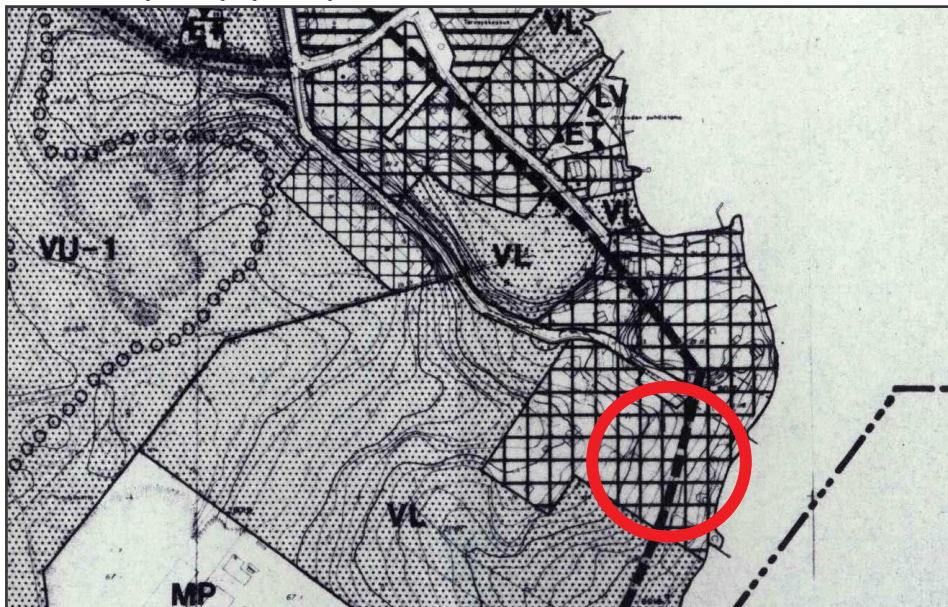
Kuva 2: Ote kirkonkylän osayleiskaavasta.

Kirkonkylän osayleiskaavassa alue merkitty asuinalueeksi. Kaupunginvaltuusto on hyväksynyt osayleiskaavan 21.12.1983 (kuva 2).