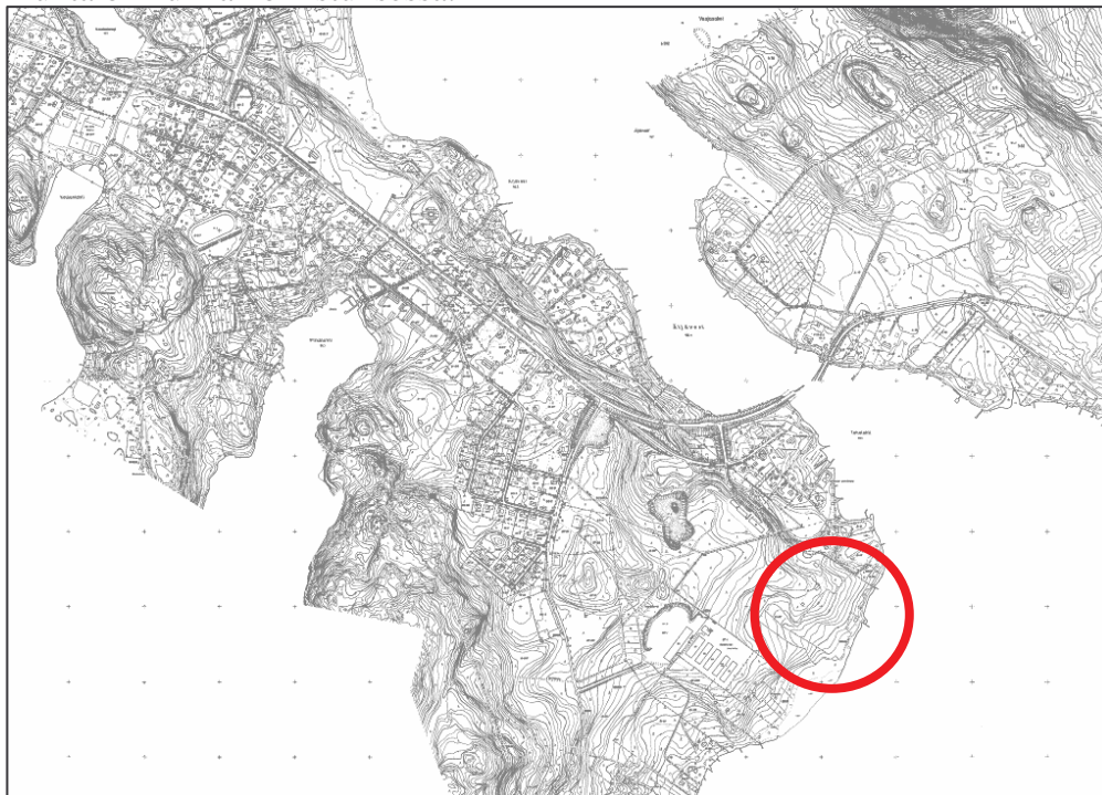
Kuva 1: Kaava-alueen sijainti