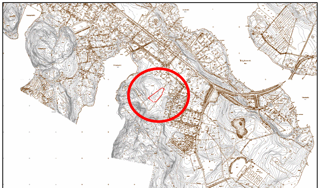
Kuva 1: Asemakaavan muutoksen sijainti ja raja- aus.

Asemakaavalla poistetaan korttelien 117 ja 118 välissä ole kevyenliikenteen varaus, joka liitetään viereisiin rakennuspaikkoihin.