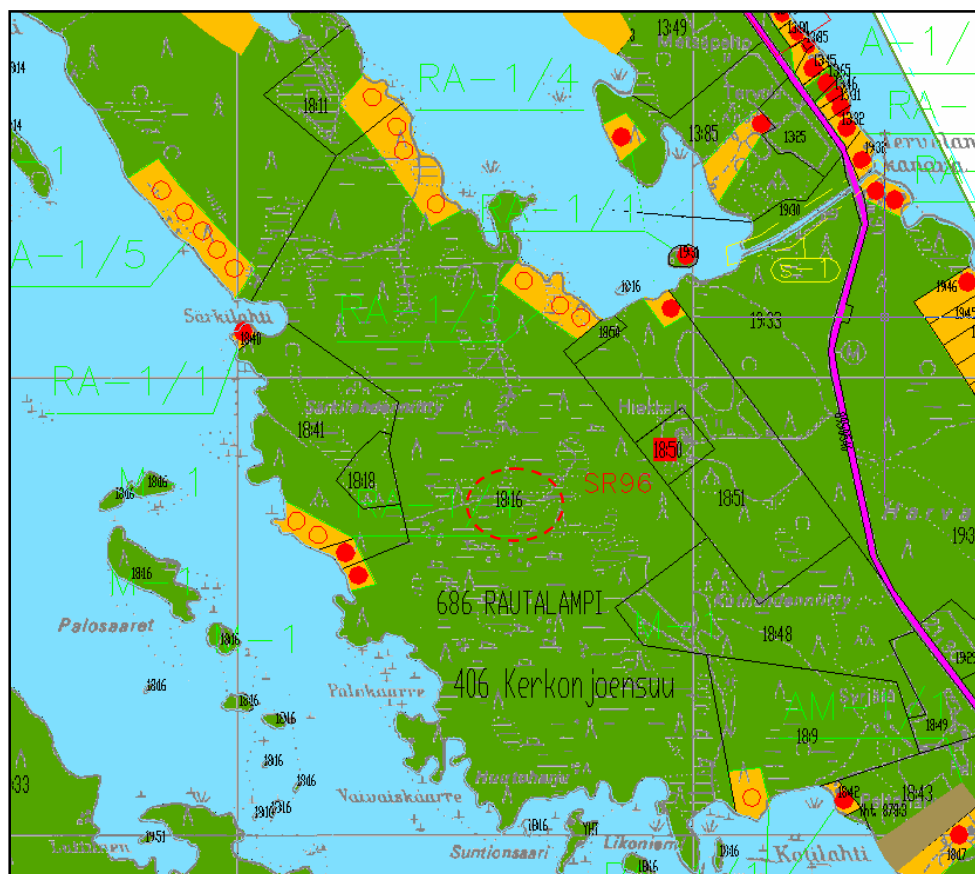
Kuva: Ote Niiniveden rantaosayleiskaavasta

Rautalammin kunnanvaltuusto on hyväksynyt Niiniveden rantaosayleiskaavan 11.11.1998 §84.