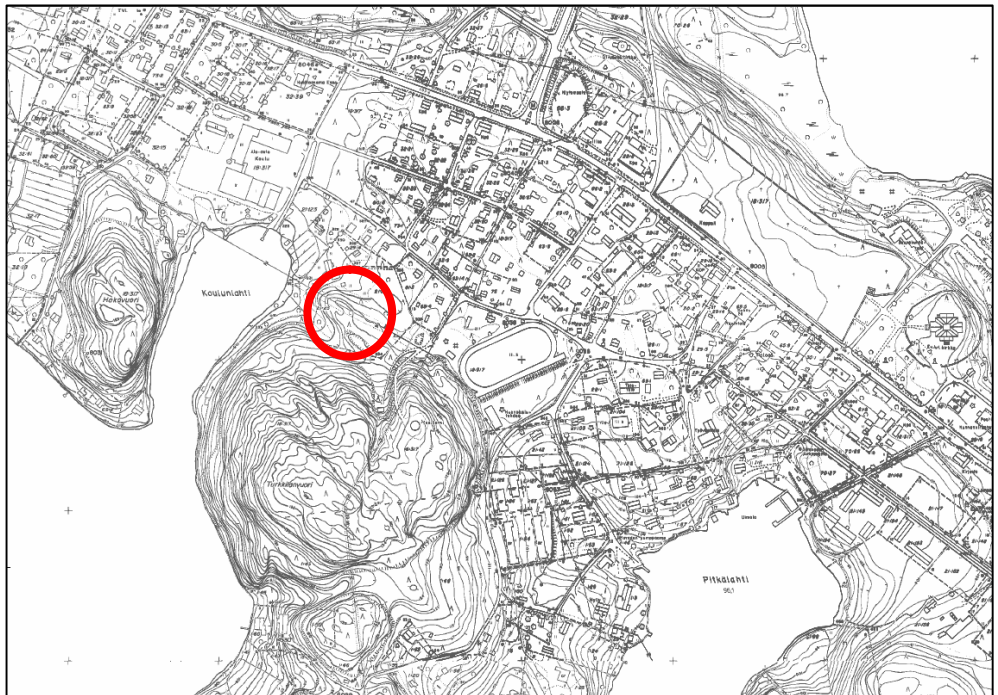
Kuva 1: Kaava-alueen sijainti

Asemakaavan tavoitteena on sijoittaa alueelle kotimaista biopolttoainetta käyttävä lämpövoimalaitos.